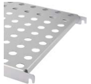
Lochboden 1.5 mm stark Ø 24 mm Teilung 50 mm