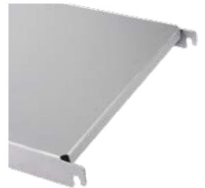
Boden 1.5 mm stark